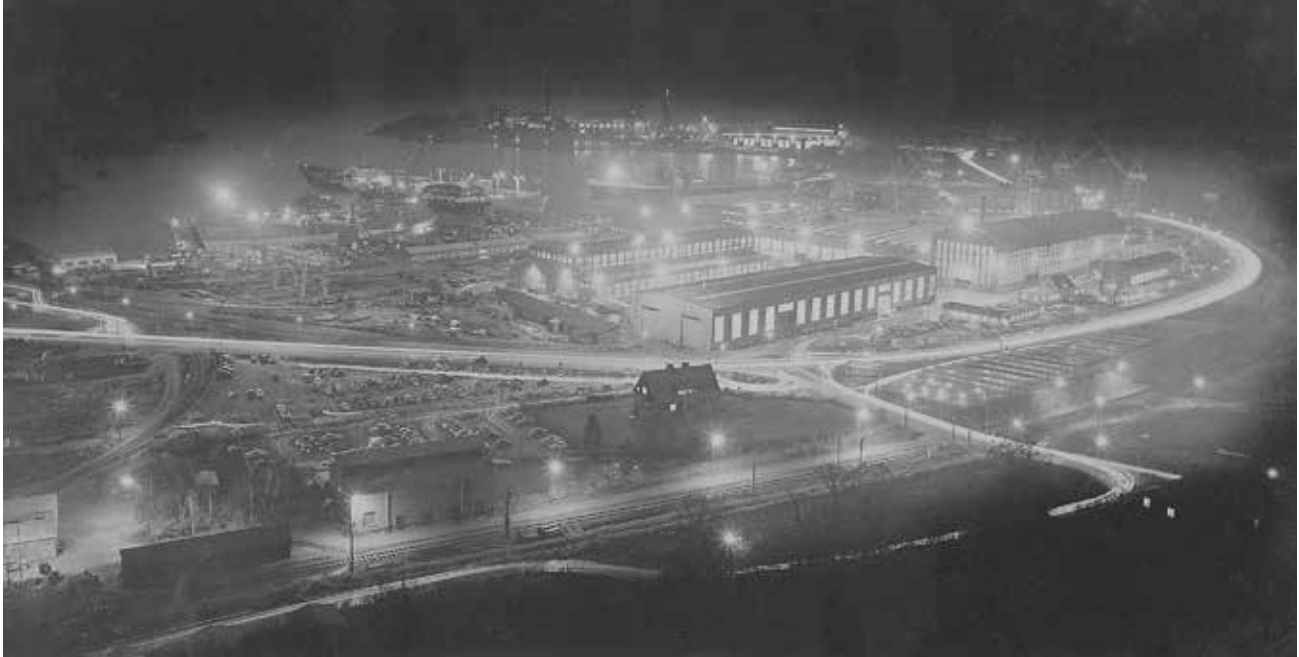
Uddevallavarvet i full verksamhet.