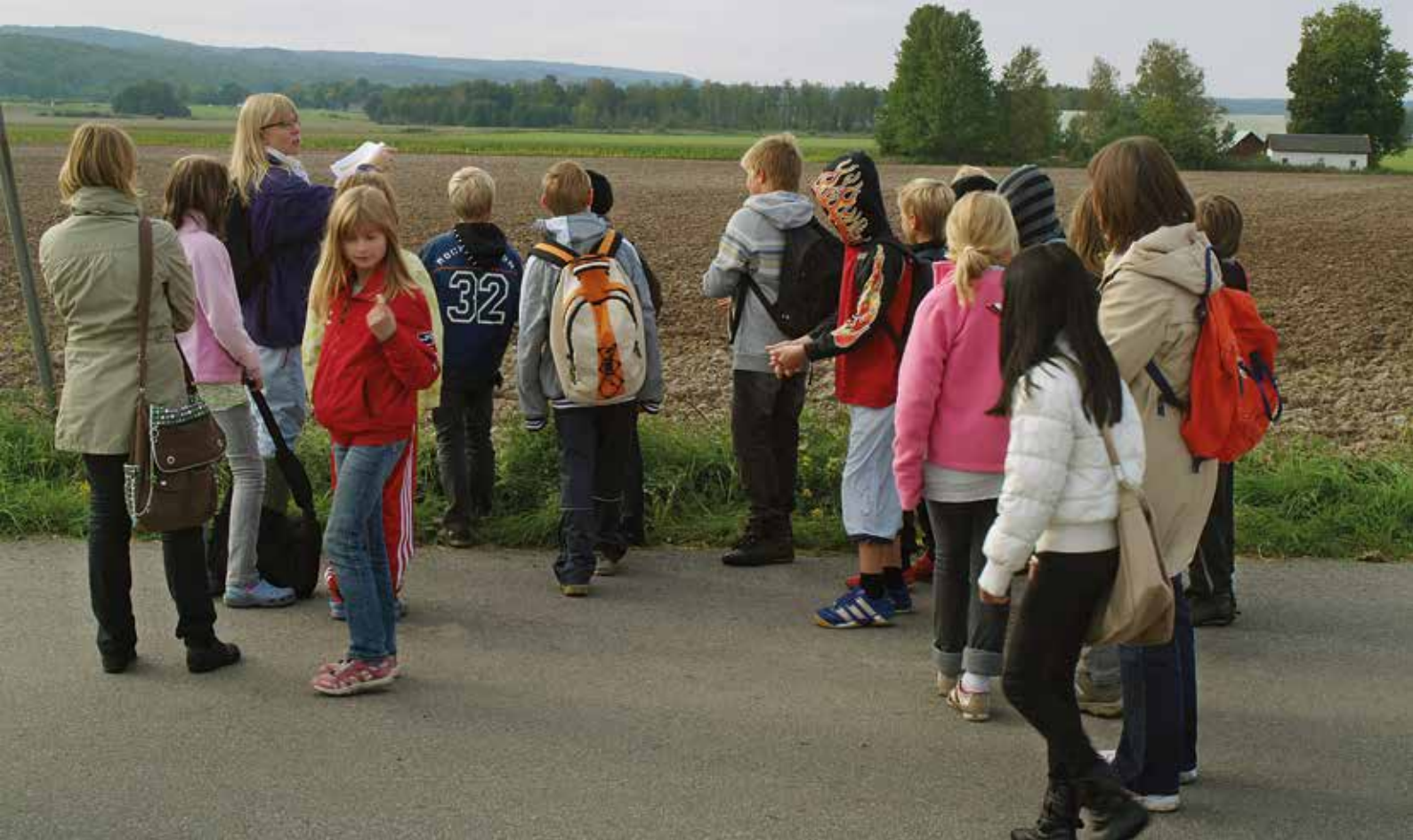
Vem ska ta hand om kulturlandskapet i det moderna samhället?