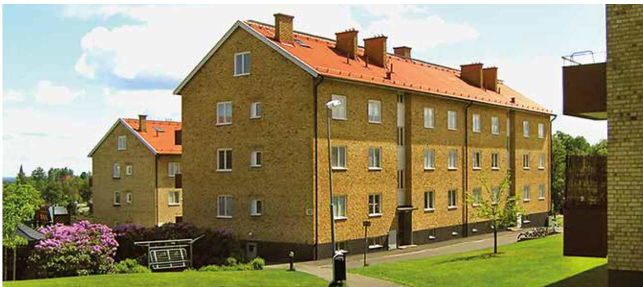
Bostadsbebyggelse i Skövde.