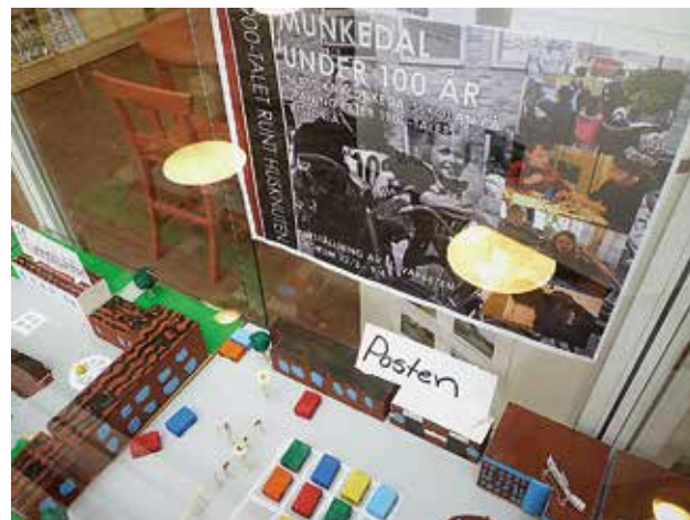
En skolklass har letat efter berättelsen om samhället de lever i.

Med exemplet Skanstorget i Göteborg prövades ett sätt att fånga upp utvecklingsidéer för ett torg som tappat mycket av sin torgidentitet på grund av alla de p-platser som finns där. Vid ett endagsevenemang, kallat »Platslig hjärt- och lung räddning«, där bland annat soffor placerades ut, förmedlades platsens historia och