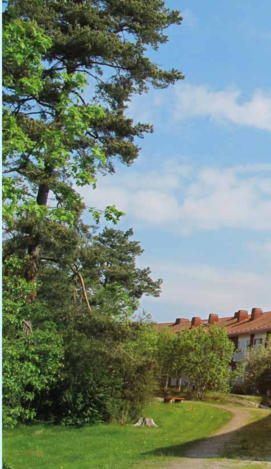
Kvarteret Björnbäret i Trollhättan.