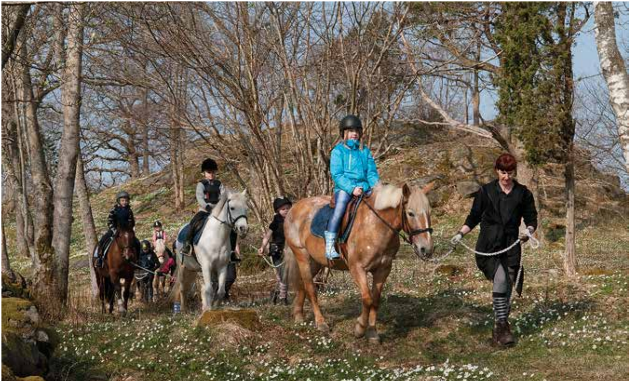
Kulturlandskapet blir rekreationslandskap.

Rapport: Från odlingslandskap till rekreationslandskap Rapport 2010