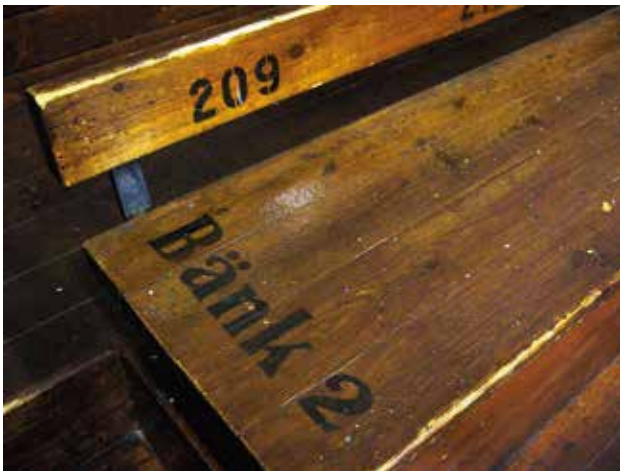
Väl nyttjad fritid. En bänk på en idrottsläktare. Lysekils idrottshall.

Länsmuseerna i Västsverige (efter 2006 Västarvet), Göteborgs Stadsmuseum och Länsstyrelsen hade sedan tidigare en tematisk samverkan i byggnadsvårdsfrågor, kopplat också till fördelningen av kulturmiljö-