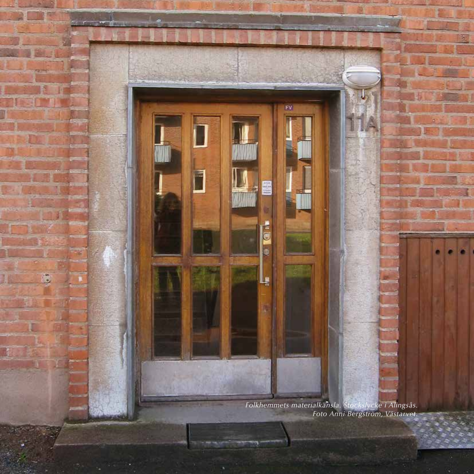
Folkhemmets materialkänsla. Stockslycke i Alingsås.