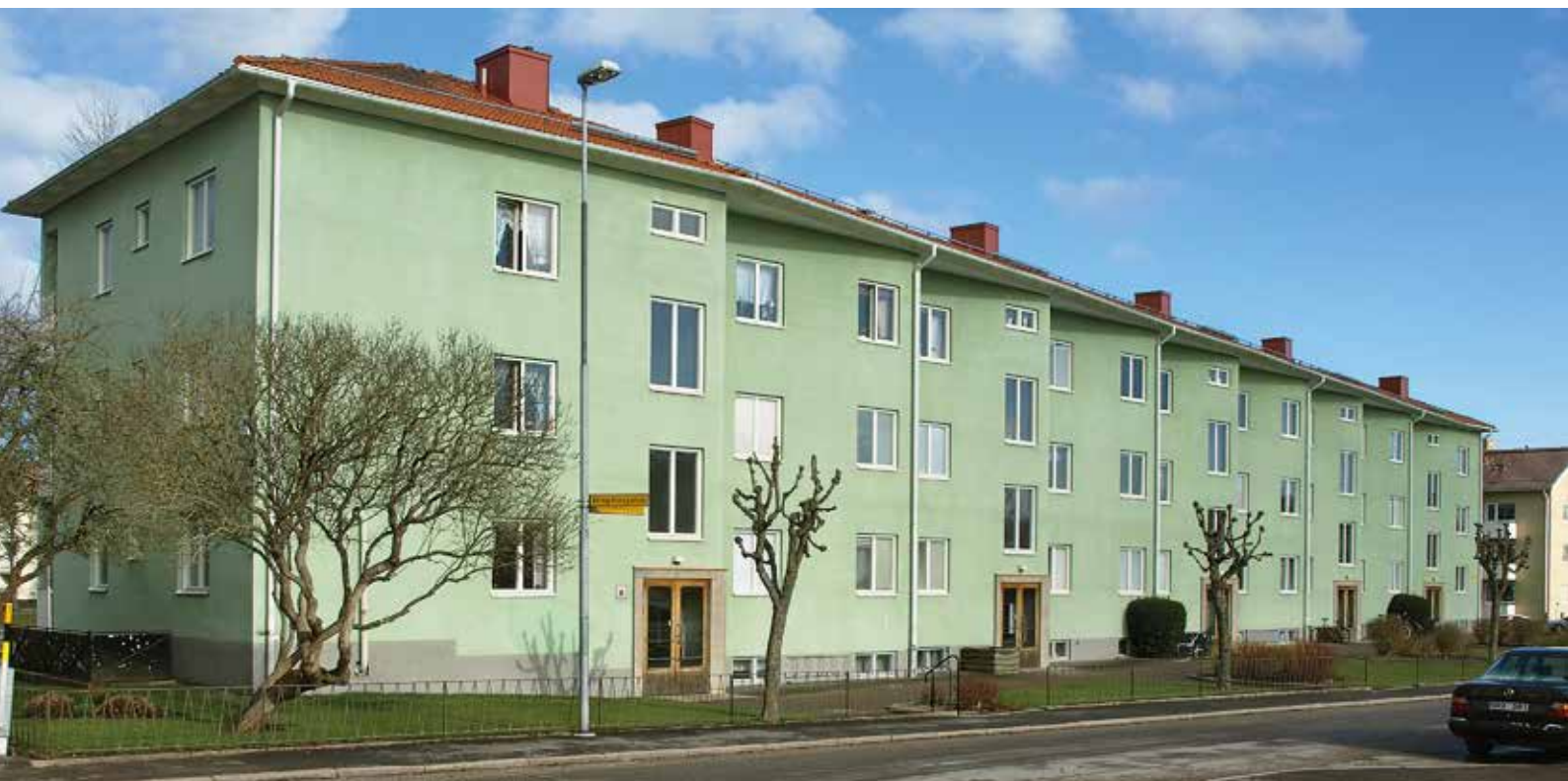
Kvarteret Vinkelhaken, Grönelundsgatan i Falköping.