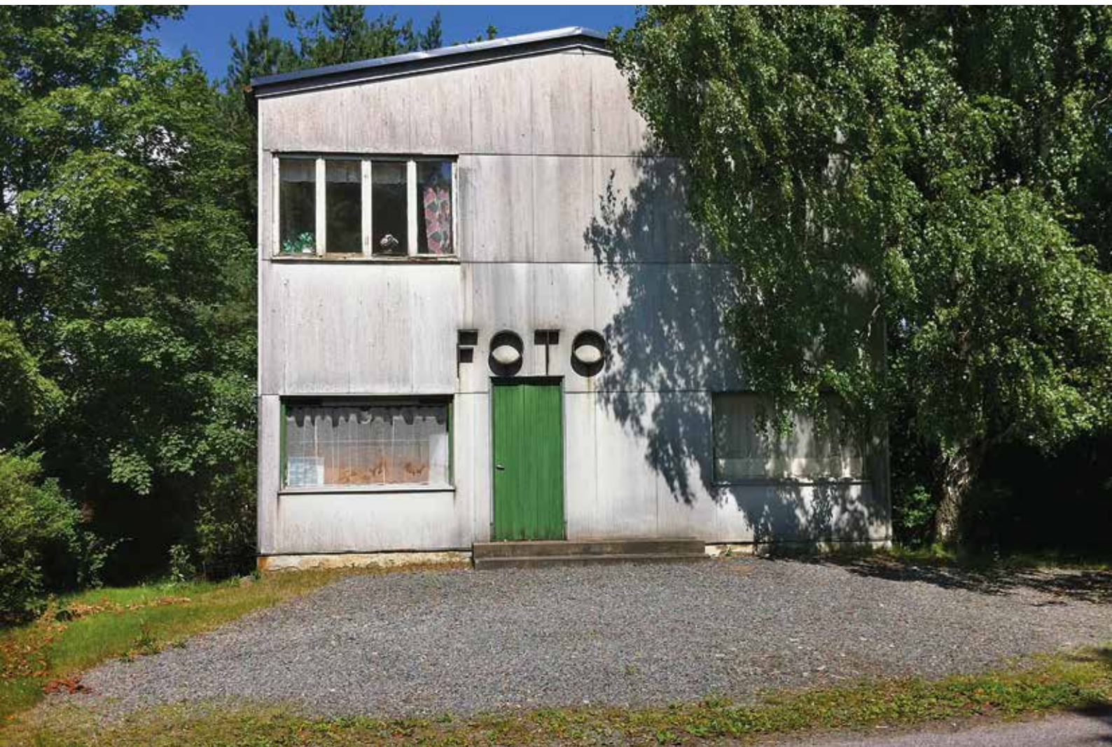
Moderna Västra Götaland innehåller också berättelsen om en samhällsomvandling där människor flyttar dit jobben finns. Nedlagd fotoaffär i Fritsla.