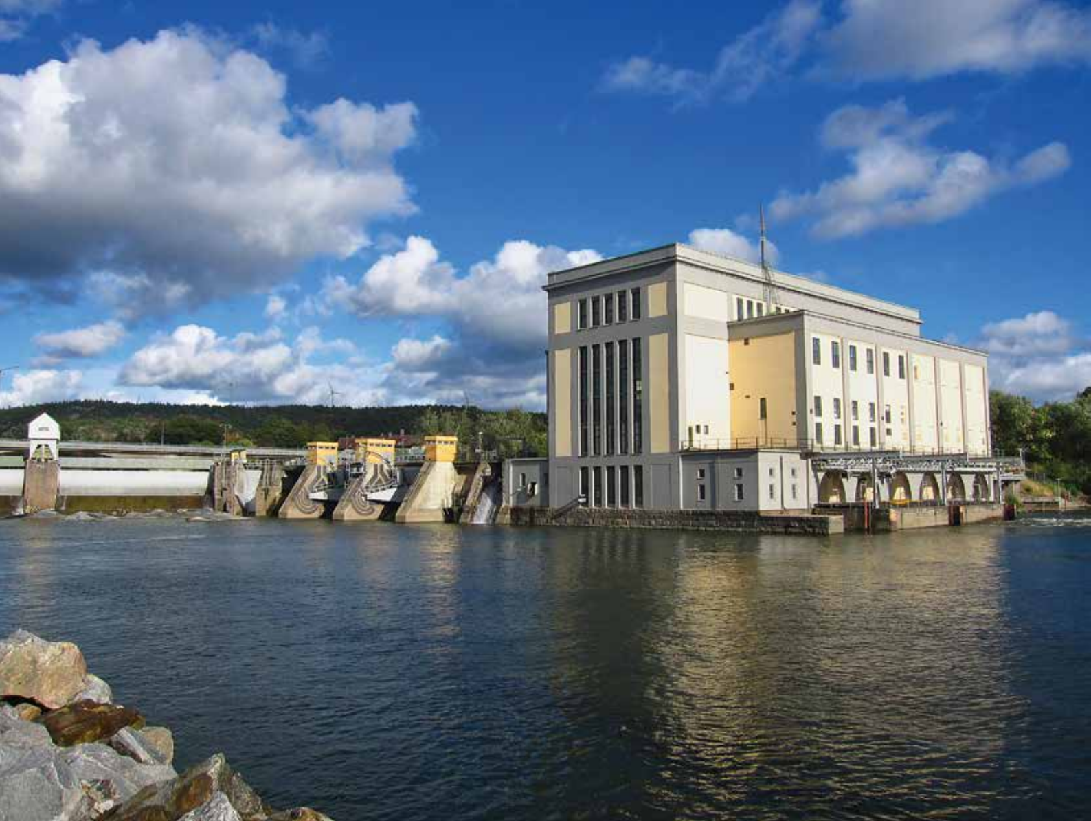
Det moderna samhället är ett energislukande samhälle. Lilla Edets kraftverk i Göta Älv.