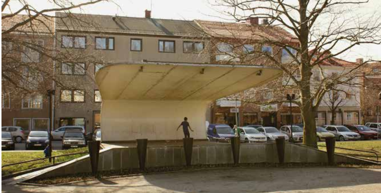
Dags att på allvar integrera de modernare objekten i arbetet med städernas kulturmiljöer? Margretegårdeparken i Uddevalla.

öppna heldagsseminariet Modernare kunskapsunderlag Kulturmiljövårdens arbetsformer och utmaningar i kritisk belysning.