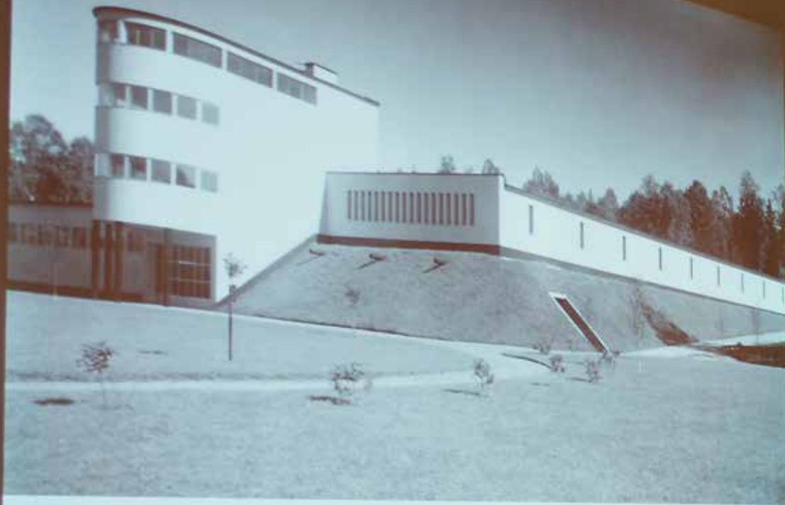
Seminariet Framtiden vi byggde i Nossebro 2011. Stadsantikvarie Fredrik Hjelm om guldåldern i Borås. På bilden Borås vattenverk.