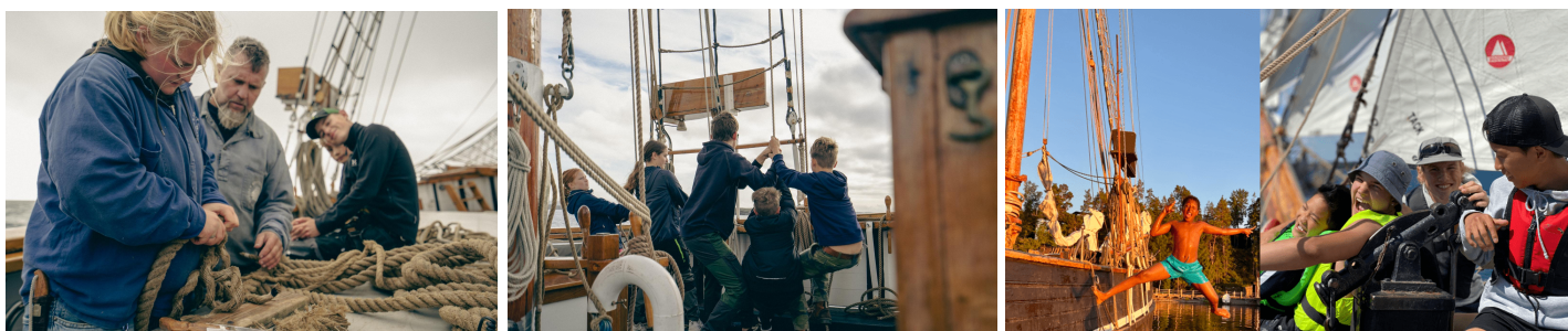
Ombord på skolsegelfartyg i skärgården.