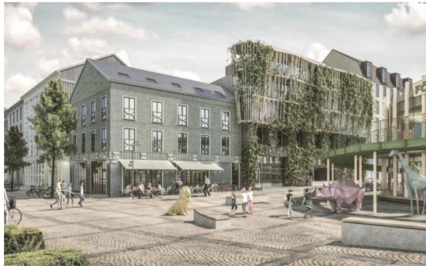
1803 göteborgare valde att lägga sin röst på det vinnande förslaget Haga hjärta Linné.