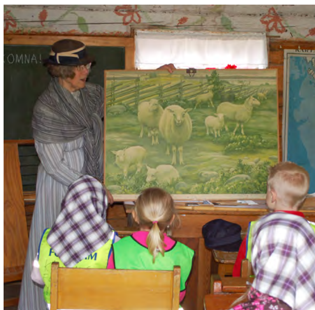
Förskolans dag. I maj fick förskoleklasser möta historien på Bokenäs hembygdsgård.

Förskolans dag arrangerades i maj på Bokenäs hembygdsgård för 52 fem-åringar från Matildaskolans förskolor. Barnen fick prova på en mängd gårdssysslor från förr. En inspirationsdag för 60 förskolepedagoger och Bokenäs hembygdsförening ordnades i april, liksom besök i Matildaskolans fyra förskolor med tema föremål. Med de medel som beviljats av Thordénstiftelsen till utveckling av projektet har ett arbete påbörjats för att sprida metoden, bl.a. genom en inspirationskrift som håller på att ta form.