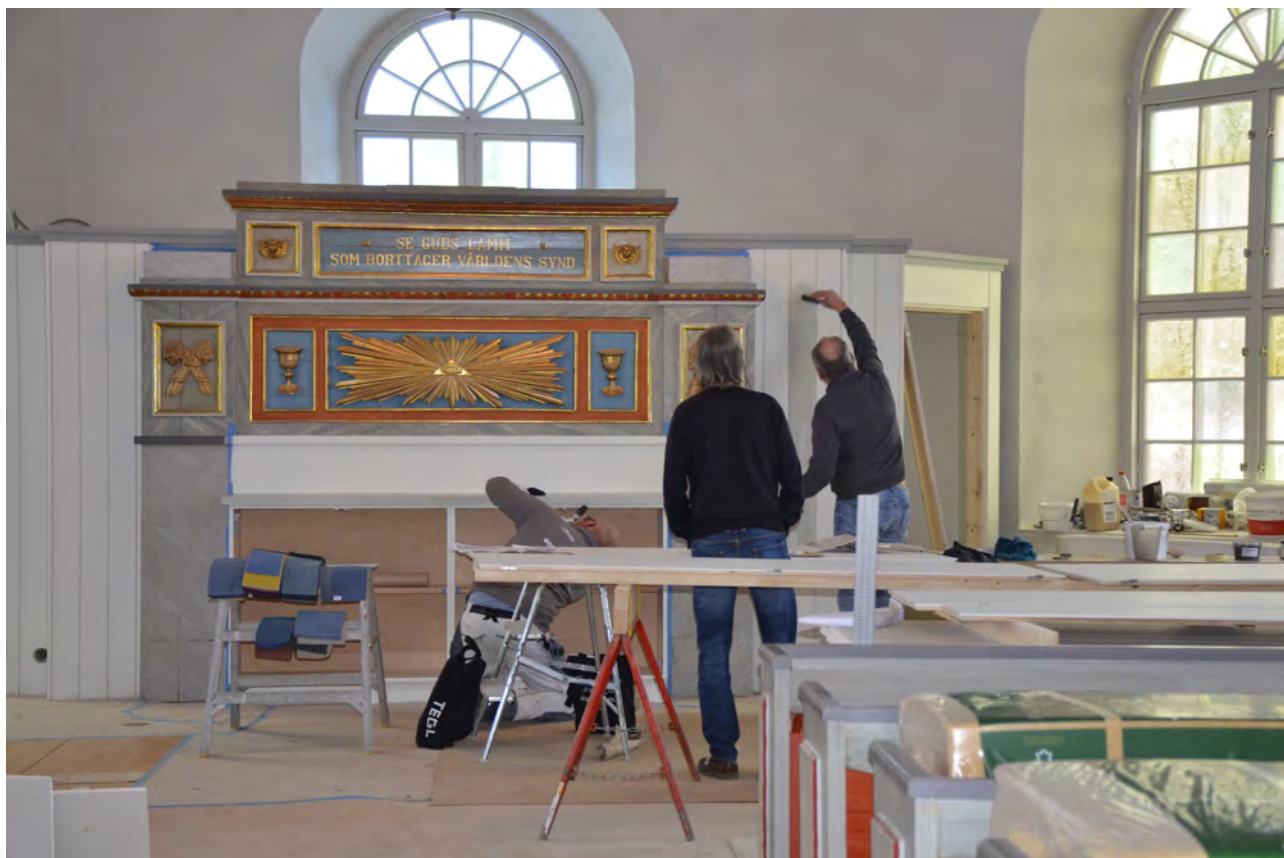
Museet följer många kyrkorenoveringar som antikvarisk medverkande. Här pågår byggmöte i Långelanda kyrka, som genomgått en stor renovering 2018-2019.

Museet har medverkat också vid restaurering/renovering av bostadshuset på Näverkärns gård, Härnäset, liksom reparationer på Idefjordsvallens läktare, knottfabriken i Lahälla, port till fastigheten Skarpe Nord 7 vid torget i riksintresset Gamla Kungälv, Fjälebro väderkvarn, Tjörn, och vid konservering och lagning av ett dekorationsmålat innertak i Villa Ljungby på Lyckorna. Vi har varit sakkunniga vid renovering av Käringöns lotsutkik.