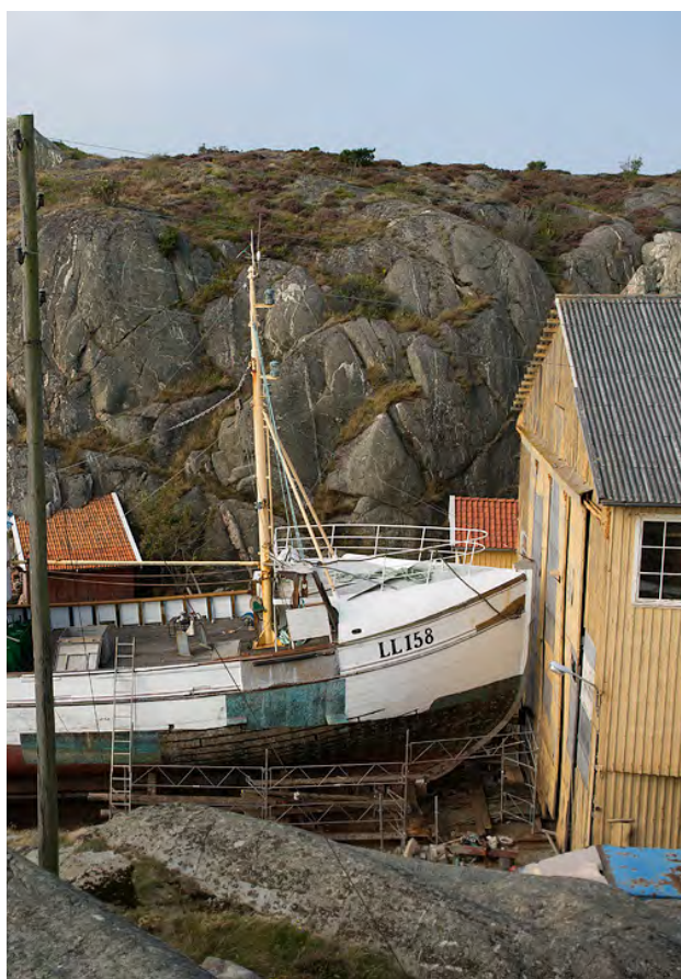
LL158 Sandö på Hälleviksstrands varvs slip för reparation.

Liksom många andra museer i Sverige är uthyrning av konferenslokaler en viktig del av verksamheten. De största uthyrningsmånaderna är mars-april där vi hade 24 konferensdagar per månad.