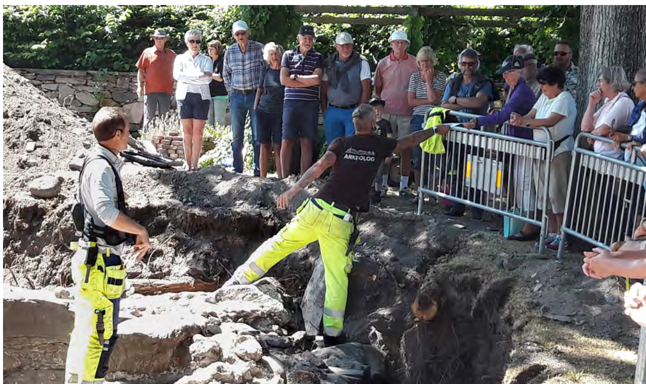
Visning för allmänheten vid undersökningen av lämningarna från Marstrands kloster.

Ett kulturmiljöpedagogiskt program tillsammans med eleverna i årskurs 6 på Bojarskolan, Strömstad. De fick uppleva lämningar från kanonbatterier från 1717–18, smaka på soldaternas matransoner och prata om livsbetingelserna i den dåtida armén.