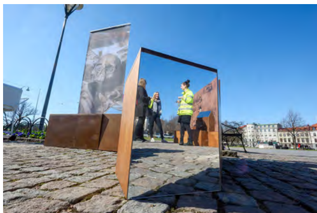
Den mobila utställningen Möt det förflutna , här placerad utanför Bältespännarparken i Göteborg under Vetenskapsfestivalen. Utomhus bemannade arkeologer som höll i workshops och visade föremål från undersökningar.

Våra arkeologiska lektioner innefattar precis som inom naturområdet både lektioner förlagda i museet och utanför väggarna. I punkter som Livet i den glömda staden och Möt det förflutna fick elever ta del av arkeologiska föremål, lära sig om de arkeologiska tolknings- och slutledningsprocesserna i relation till några av de 1500-tals fynd som gjorts vid utgrävningen av Nya Lödöse. Utomhuslektionerna introducerade elever till begreppet fornlämningar, och hur de kan upptäcka synliga och osynliga spår från en annan tid i sitt närområde. I förlängningen får de också fundera på hur landskapet har förändrats över tid.