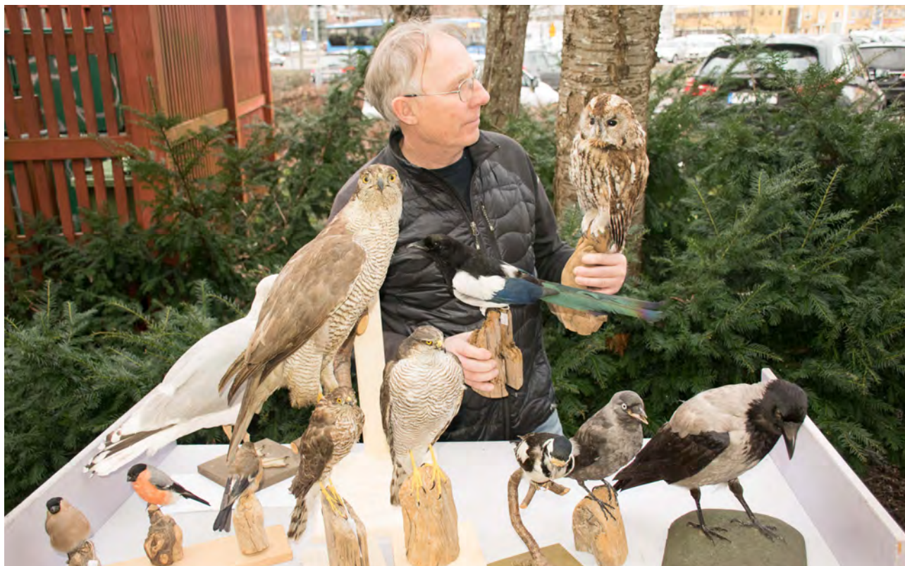
Fågel-Jannes skådarskola är en uppskattad och återkommande aktivitet som under året bestod av både lektioner inomhus och exkursioner.