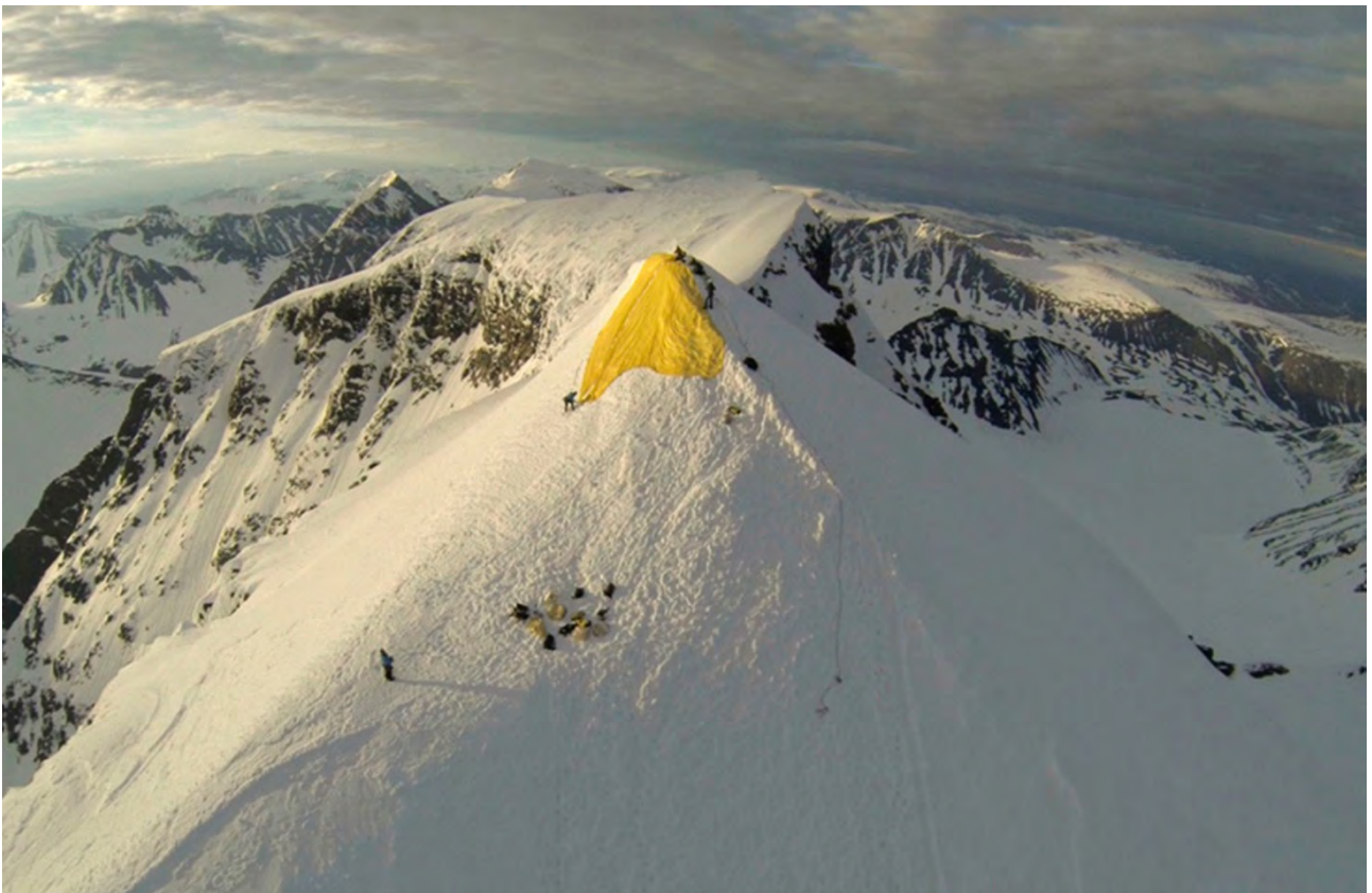
I en operation för att bromsa smältningen av Kebnekaises sydspets placerade Bigert & Bergström en skyddande filt över toppen. Verket går att se i utställningen The Climate Fix . Foto: Bigert & Bergström