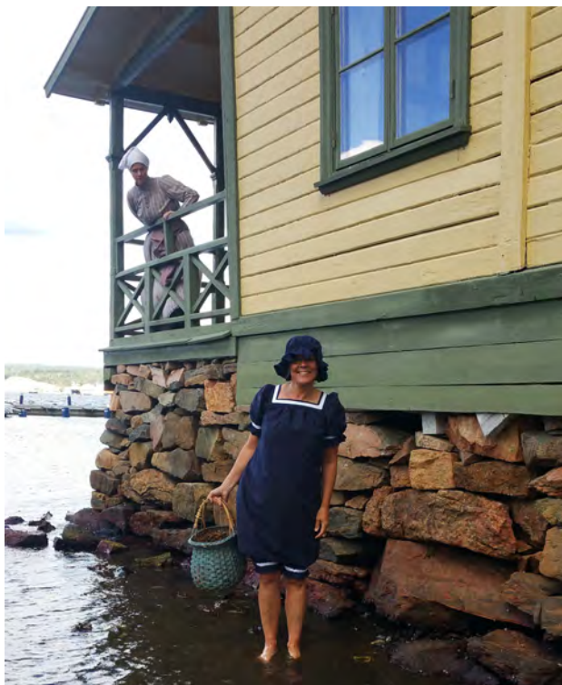
Baderskan Hermina tar ett dopp i smyg i badmode anno 1899, hon blir dock upptäckt av en annan baderska som förfasas av det hela... Vid varmbadhuset i Gustafsberg.

En pedagogisk aktivitet som utnyttjar det kulturarv som finns i landskapet i skolornas närmiljö. Under året har vi varit i Hogstorps skola,