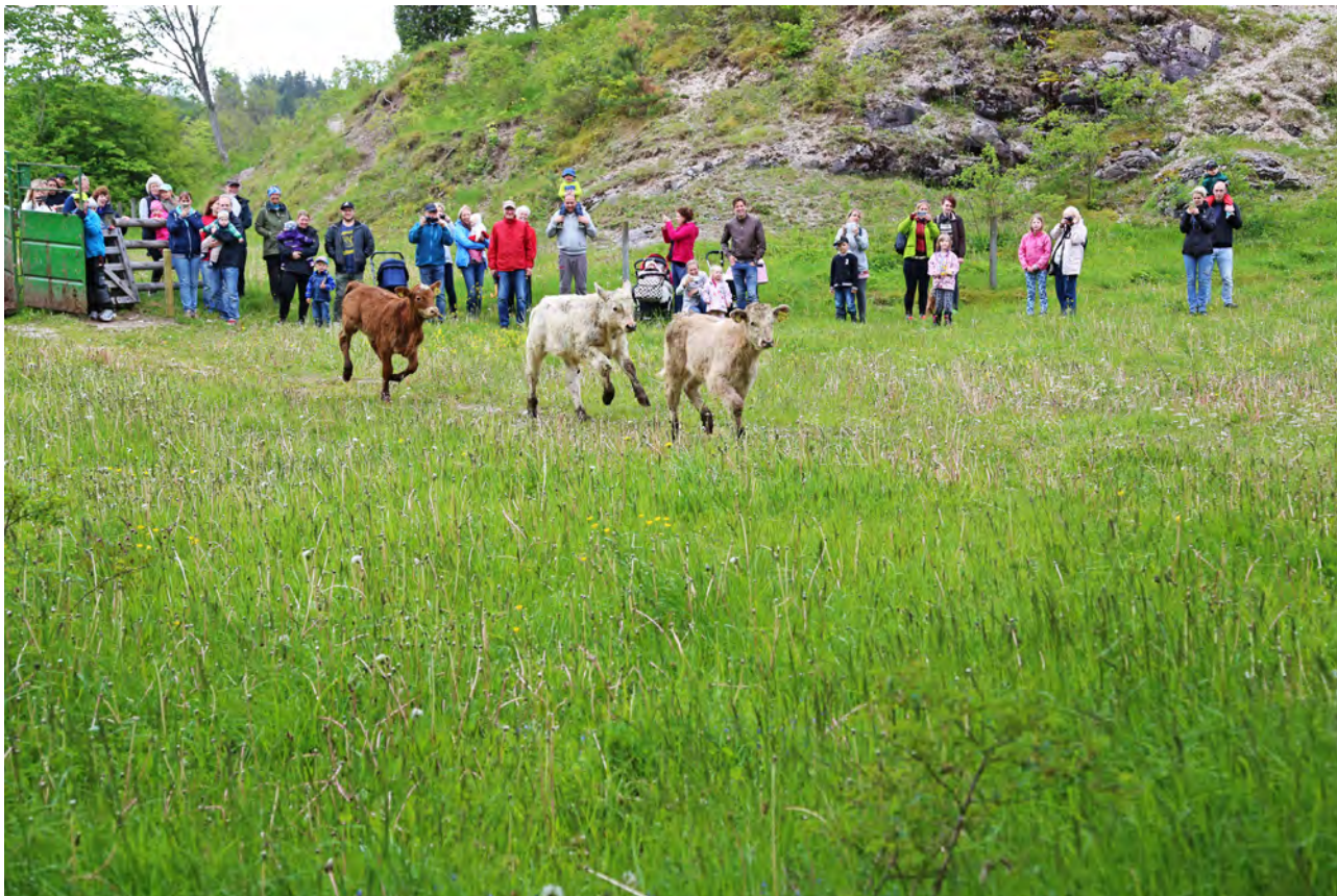
Kosläpp på skalbankarna.