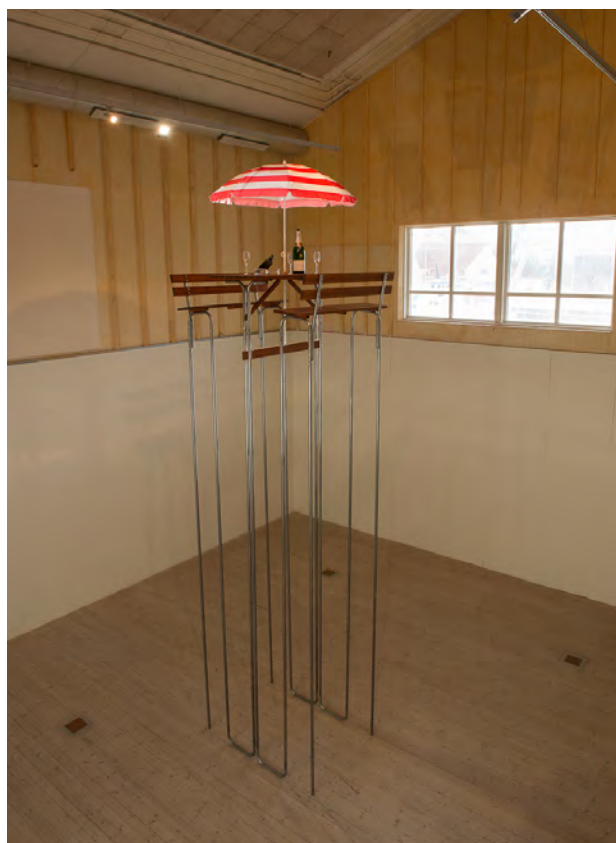
Konstnären Mattias Norström har skapat ett minst sagt svårtillgängligt bord.

Det konstpedagogiska arbetet som följde innebar 25 skollektioner för förskola och gymnasium, liksom workshops för Kulturskola respektive daglig verksamhet och NIKE ungdom. De workshops som gjordes med daglig verksamhet resulterade i miniutställningen Väktarna som visades i Lilla filmrummet. Gymnasieelever i årskurs 1–3 från Bild- och form deltog på konstnärssamtal med två av de utställda konstnärerna.