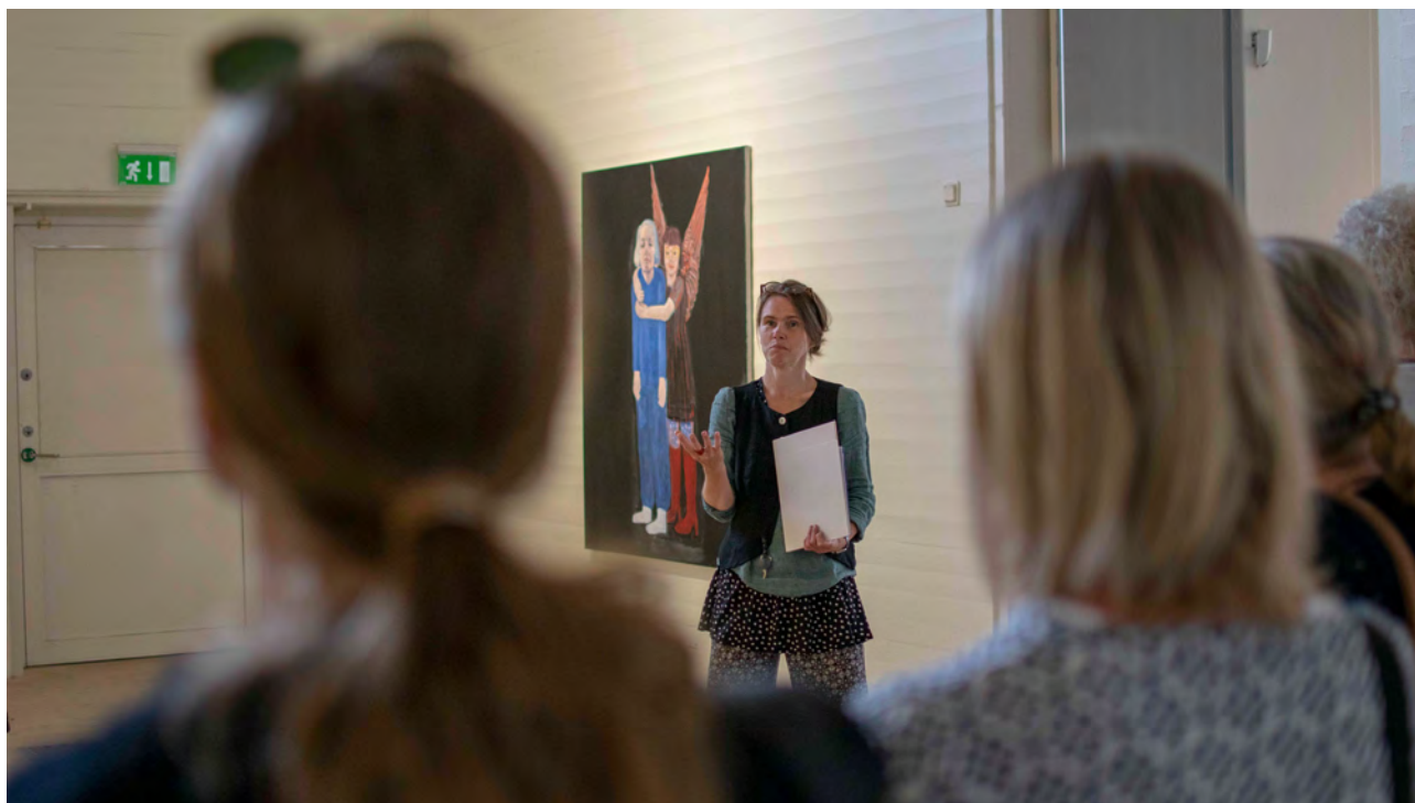
Vi har under året hållit i en mängd av varierande visningar och lektioner kopplade till både de tillfälliga konstutställningarna och våra egna konstsamlingar.

Samarbetet med Uddevallaungdomen Ruqaya Hassan resulterade i Dialog med samlingen – Fyra porträtt av Ruqaya Hassan , ett möte mellan teckning och fotosamling.