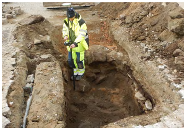
Arkeologiska undersökningar och schaktkontroller i centrala Uddevalla har givit ny kunskap om det äldre Uddevalla.