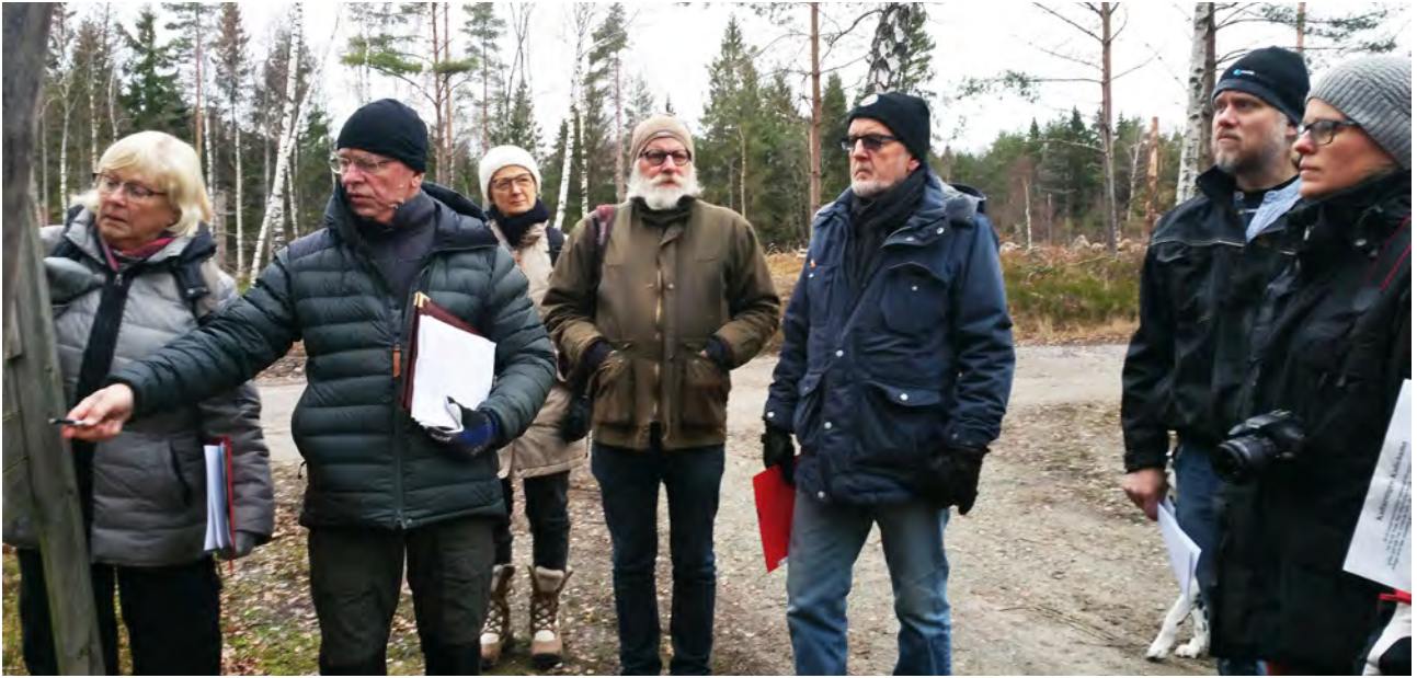
Allt berättar historia, satsningen där kulturarvsföreningar besöker sina kulturmiljöer, har inletts under 2018 och fortsätter under 2019. Provinventering i november bland torplämningarna på Kultehamn.