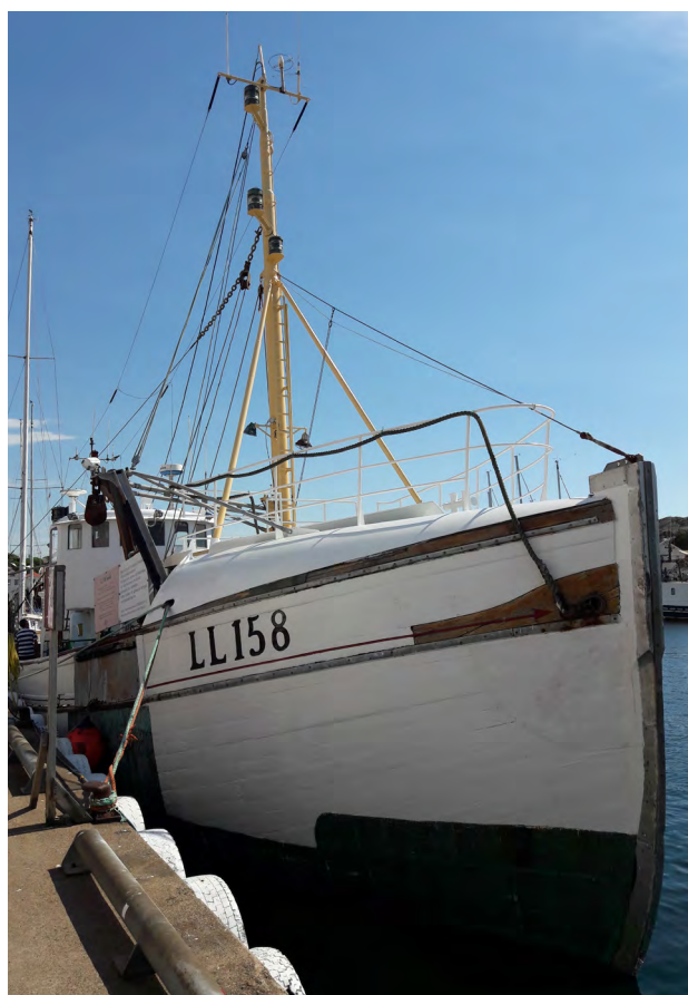
Den gamla vita träfiskebåten Sandö under Västerhavsveckan, här liggandes vid kajen i Grundsund.