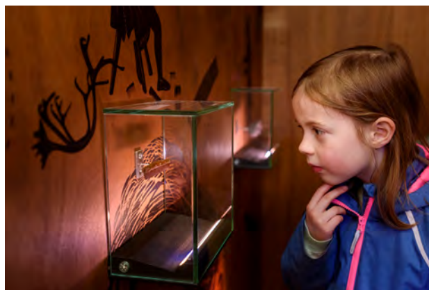
Inomhus kunde besökarna gå på upptäcksfärd i ett interaktivt, lekfullt universum som berättade om vardagsliv, varuutbyte och vandringar i de nordiska städerna Uddevalla, Göteborg, Köpenhamn och Odense.