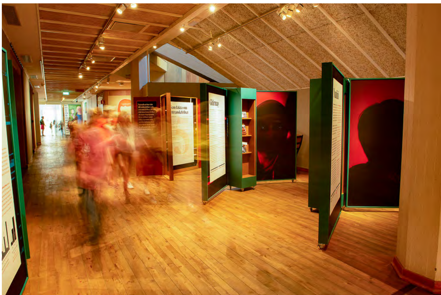
Fristadsutställningen har efter sin tid på museet visats i Bengtsfors för att nu flyttas till Borås.

I anknötning till utställningen visade vi den belönade dokumentärfilmen One Day in Aleppo av den syriske stipendiaten och journalisten Ali Alibrahim. Utställningen är ett samarbete mellan Västra Götalandsregionen, regionens fristadskoordinator samt Bohusläns museum. Projektet delfinansierades av Statens Kulturråd.