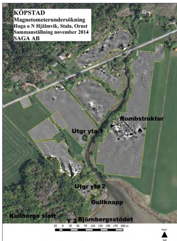
Flygfoto över Orust köpstad.