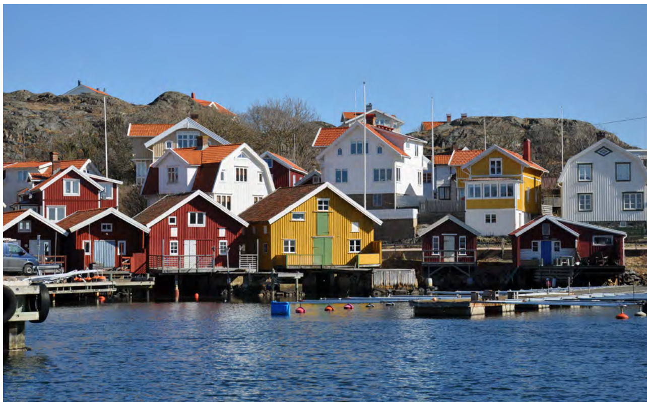
För Hälleviksstrand och Edshultshall har museet genomfört en kulturmiljöutredning med anledning av kommande planarbeten.

riksintresse för kulturmiljövården och det var angeläget att utreda hur utbyggnaden påverkar miljön. Likaså har en översiktlig bebyggelseanalys av Hälleviksstrand och Edshultshall genomförts inför planprogram. Vidare sakkunnig bedömning av kulturvården i samband med biotopvårdande åtgärder i Aspaån, i Askersunds kommun, Örebro län, i samarbete med Västarvet. Kyrkogårdsinventeringar med kulturhistorisk utvärdering av gravplatser har genomförts för Härryda-Landvetter pastorat (2 kyrkogårdar) och Sotenäs pastorat (6 kyrkogårdar). Här kan särskilt nämnas Sandborgens begravningsplats, med mycket väl bevarade gravkvarter från 1900-talets första hälft.