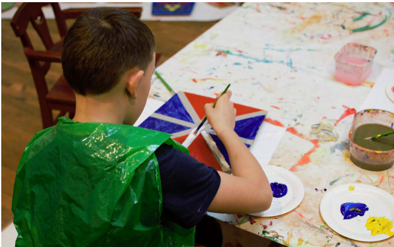
Under några dagar på höstlovet förvandlades Hyllan till en välbesökt sköldverkstad.

En tredje aktivitet var att barnen fick skapa sin egen sköld, detta med koppling till utställningen I sjöfararnas spår . Här kombinerades det kreativa arbetet med en presentation av heraldiska sköldar, vad de kommunicerade och hur de kunde se ut.