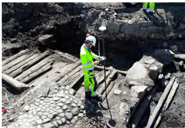
Arkeologiska undersökningar vid Kungstorget i Uddevalla. Lämningar från många hundra år tillbaka i tiden kom i dagen.

2018 inleddes ett arbete med undersökningar i Uddevalla stad i samband med de upprustningsarbeten som inletts i Uddevalla centrum. Syftet var att få ett samlat grepp om Uddevalla stads äldre historia, liksom att göra detta tillgängligt digitalt. Genom flera undersökningar och schaktkontroller, inte minst vid Kungstorget, har vi ökat förståelsen för Uddevallas olika skepnader, 1600-tals staden och 1800-tals staden, men vi har även funnit spår från 1500-talet.