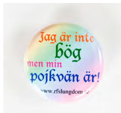
HBTQ-motiv representerat i samlingarna.