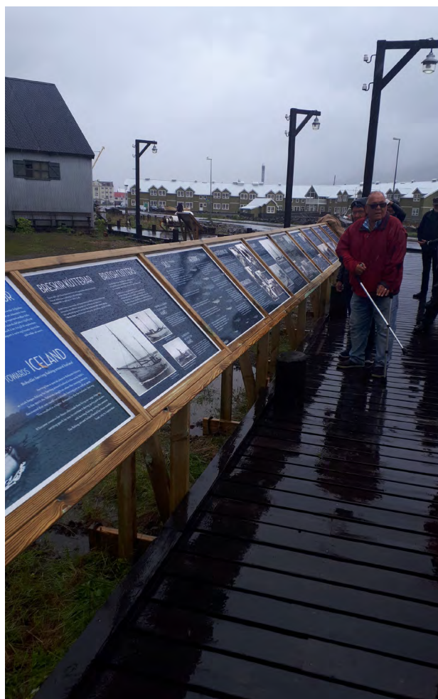
Det regnande rikligt i Siglufjörður under invigningen av På väg mot Island. Utställningens format skiljde sig åt mot den större och inomhusanpassade på Bohusläns museum.

I Gamlestaden i Göteborg avslutades hösten 2017 Västsveriges största stadsarkeologiska utgrävning någonsin. Det var där som Nya Lödöse låg mellan 1473 och 1624. Vandringsutställningen I en hamnstad på 1500-talet skildrade livet i staden på 1500-talet, liksom de tillvägagångssätt arkeologer nyttjar för att ta reda på det. I samband med utställningen följde en rad av pedagogiska aktiviteter som sammanlagt lockade nära 600 besökare. Efter besöket på Bohusläns museum reste utställningen vidare till Ulricehamn, Essunga, Backa och Gamlestaden.