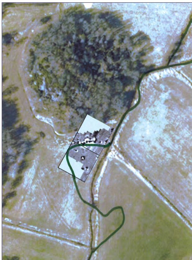
Vikingatid Orust. Flygfoto över marknader vid Strane å.

Ett kunskaps-/ forskningsprojekt som inletts under slutet av 2018 med några mindre fältundersökningar är arbetet kring Orust köpstad och våra studier av vikingatida och tidigt medeltida kustsamhällen i Bohuslän. Ett projekt i samverkan med Orust kommun som fortsätter under 2020. Utöver att projektet ska leda till en ökad kunskap om dessa samhällen har projektet också ett förmedlingsmål i att lättillgängligt presentera historisk kunskap för Orusts innevånare.