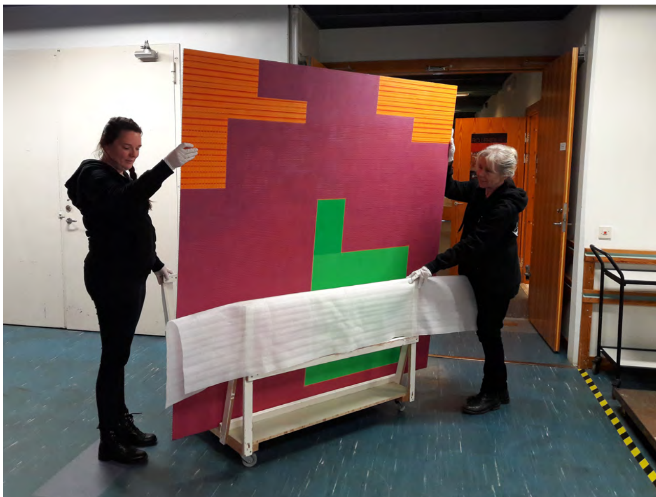
Personalen på samlingsenheten flyttar konst.

Basmagasinet är nu också helt uppordnat efter ombyggnationen 2017. Under våren gjordes en revision av samlingarna, där det kunde konstateras att museet har bra ordning och kontroll på sina föremål. Vi arbetar också kontinuerligt med skadedjurskontroll och insektsbekämpning, senast med extra sanering av en lokal som i somras hade utbrott av amerikansk änger.