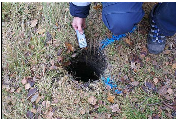
Fig 1. Exempel på en av stolpgroparna