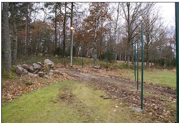
Fig 2. Vy mot Norum 29:1 med stolpar i förgrund (fr ÖNÖ)