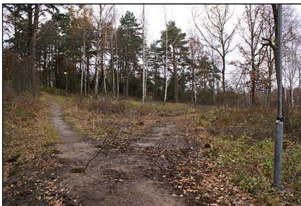
Fig 4. Vy över Obj 2 (fr S)