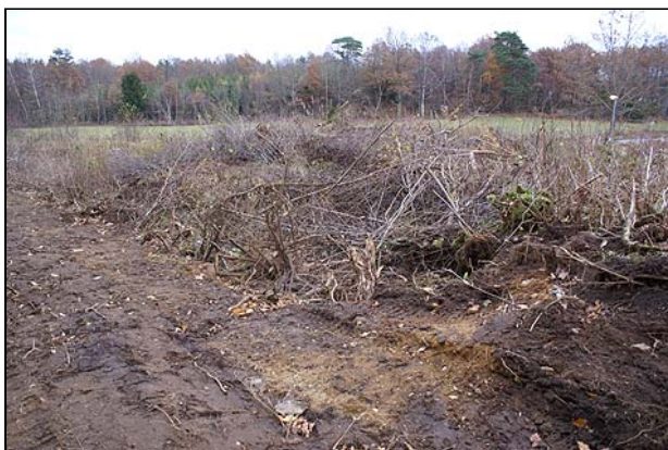
Fig 7. Översiktsbild över Norum 40:1-2 (inne i riset) (fr V)