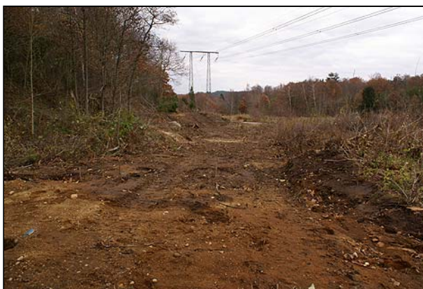
Fig 6. Avbanning invid Norum 40:1 (t.h. i bild) (fr S)