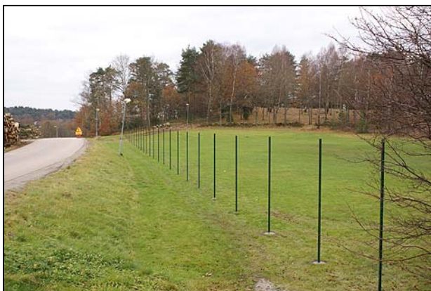
Fig 3. Gräsmatta väster om Norum 30:1 (fr NÖ)