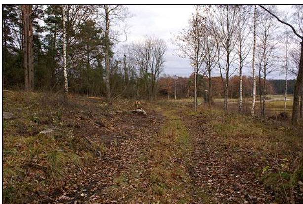
Fig 5. Vy över väg genom Obj 2, mot Norum 40:1-2 (fr SV)