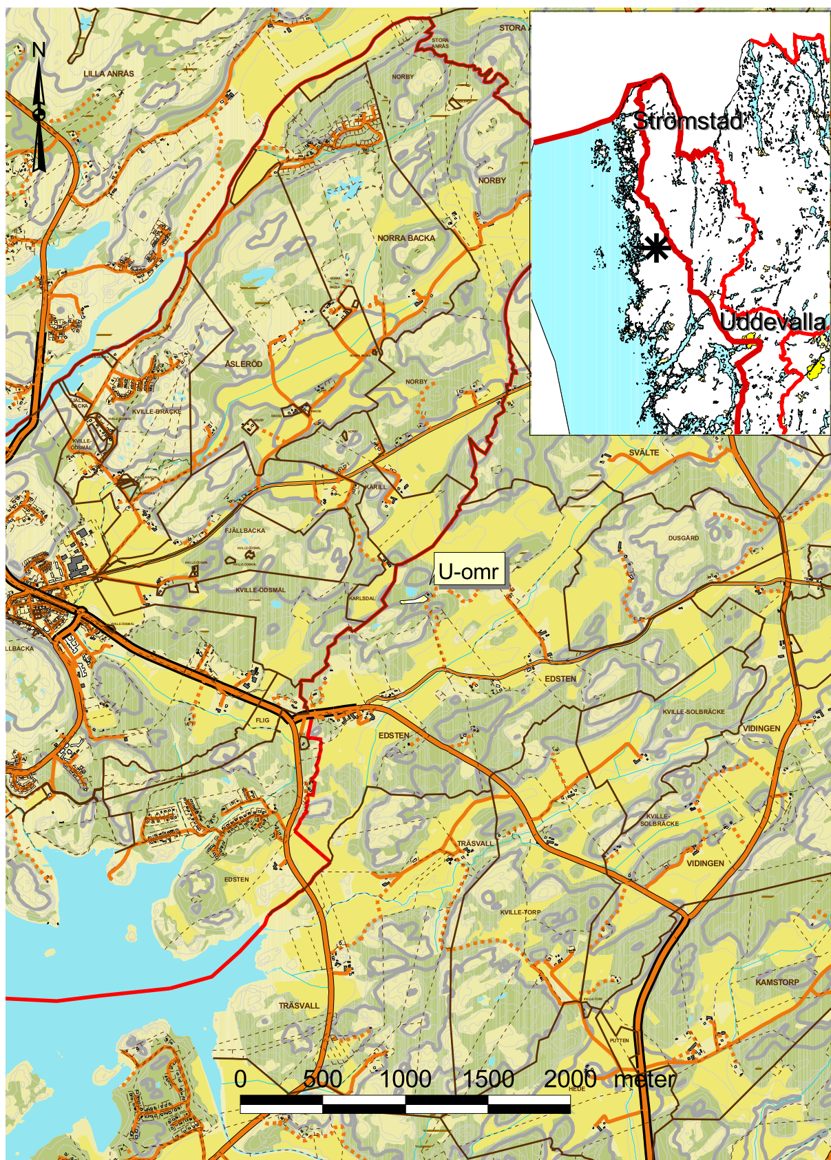
Figur 1: Utdrag ur fastighetskartan 0917 skala 1:20 000, med undersökningsområdet markerat. Godkänd från sekretessynpunkt för spridning 2006-09-20.