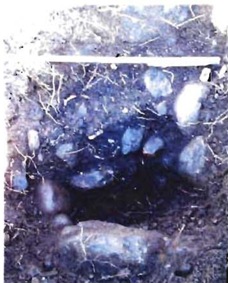
Figur 3: Kokgrop (A1) påträffad i schakt 3 i områdets sydvästra del.

Den del av boplatsen som ligger inom detaljplaneområdet visade sig vara av en ringa omfattning, eventuellt var detta utkanten av en mindre boplats, delvis redan förstörd av senare täktning. Det kan dock inte uteslutas att