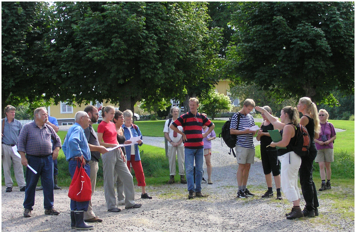
Figur 4. Gruppen samlas framför Bergs gård efter en strapatsrik nedklättring.

*438. På en liten bergsavsats hittades 15 stensatta gravar. Flera eldstäder framkom också under utgrävningarna. De kan ha använts till att laga mat vid, eller så har de spelat en roll i samband med begravningsritualen. Gravarna är minst 2500 år gamla.