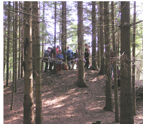
Figur 5. Skogen växte tät kring högen 148.

Stenbrott. Utmed vägen finns ett gammalt stenbrott. Här har man förmodligen brutit sten till husbehov, till exempel till husbyggnation. Brottet var förmodligen i bruk under 1800-talet och kanske in under tidigt 1900-tal, men alldeles säkert vet vi inte. Stenbrottet är en samfällighet, vilket betyder att flera gårdar ägt marken tillsammans.