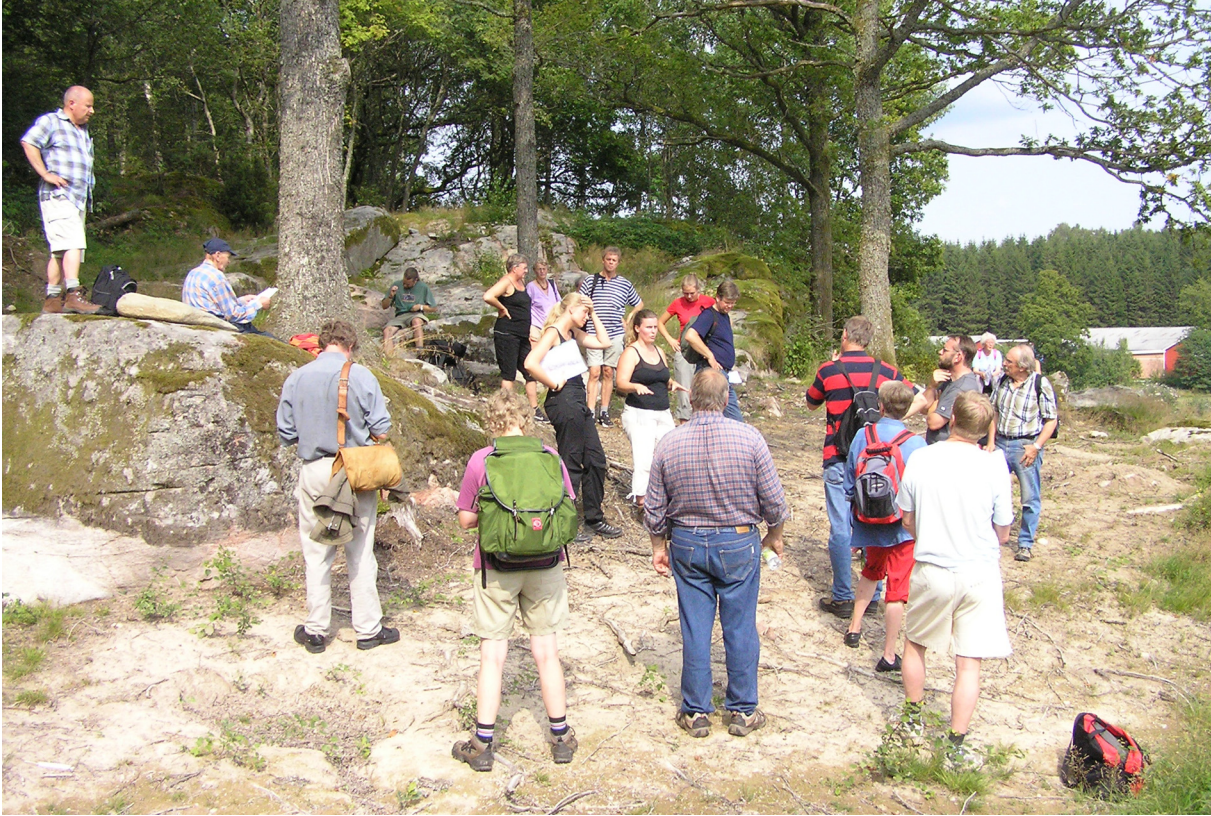
Figur 6. Utgrävningssytan där gravfältet 173 en gång legat, var fortfarande synlig. Den ovanligt varma dagen krävde sin tribut!

enligt kartan. Gården och byn skall ha fått sitt namn efter de berghällar, som omger byplatsen.