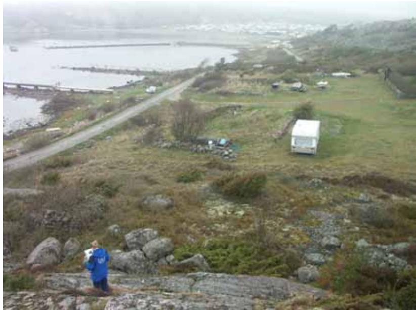
Fig. 2. Översikt över västra delen av Tanum 1826 från S.

under senare tid. Vad gäller fyndmaterial, har det inom fastighet 1:12 tidigare påträffats en större mängd krukskärvor som dock ej kom att tillvaratagas.