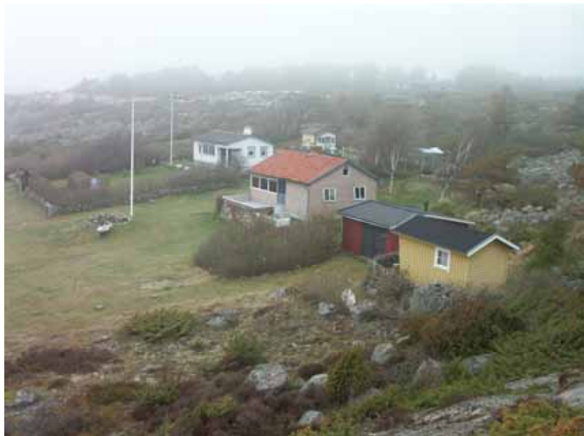
Fig. 3. Översikt över östra delen av Tanum 1826 från S.

Fornlämningen finns även omnämnd och beskriven i Johan Pettersons "Skärgårdsbebyggelse i Bohuslän under norska tiden" (Petterson 2001), där det framgår att det sannolikt rör sig om kortvariga strandsittarbosättningar från 1600-talets första hälft. Då området fotograferades översiktligt på 1950-talet var