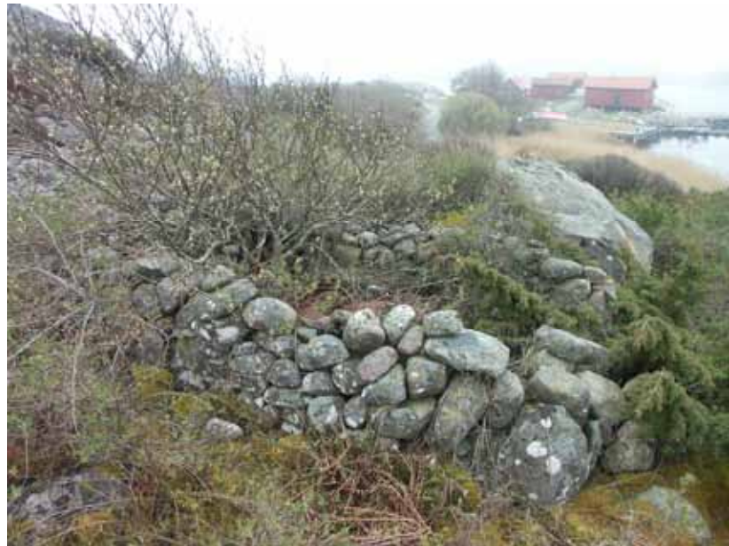
Fig. 5. Hägnad 360 fotad från Ö.

Hägnaden utgörs av en större stenmur inom vilken det idag finns ett fritidshus med tillhörande gästhus, uteplats och trädgård. I N-NO är stemmuren nästan helt borta som en följd uppförandet av gästhuset och en uteplats. Inom hägnadens NO del finns en stensatt matkällare (A340) vars ursprung kan anas på ovan nämnda fotografier från 1950-talet. Sett till storlek och form har denna sannolikt varit mycket snarlik hägnad A360 nedan. Enligt uppgift från fastighetsägaren har även gärdesgården kring huset bättrats på under senare tid.