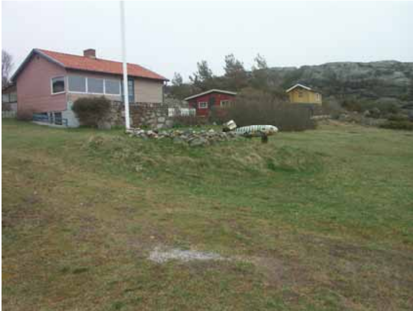
Fig. 6. Eventuell husgrund (A280) från NV.