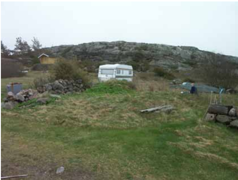
Fig. 4. Översikt över hägnad A100 från NV. Spisaröset kan ses som en förhöjning framför husvagnen.

Hägnaden utgörs av en stenmur med tillhörande husgrund med spisaröse (A160 och A380) (fig. 4). En del av stenmuren har flyttats men dess ursprungliga plats kan emellertid fortfarande ses som ett urgröpt parti i marken omedelbart Ö om husgrunden. Vid rensning i anslutning till spisaröset konstaterades tegel, bränd lera, harts samt enstaka träfragment (inga fynd tillvaratogs). Ytan har under senare tid använts för trädgårdsodling och en husvagn står parkerad i dess östra hörn.