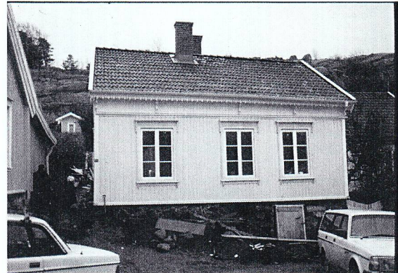
Under restaurering, fasaden klar. 1999-12

Murning och kakelugnsrenovering: PS Murartjänst (Pontus Sjöström), Krokstrand. Snickeriarbeten (dörrenovering samt komplettering av snickeridetaljor): Joreds snickeri, Hamburgsund. Urbans Kakel, Strömstad. Tanumshedes plåtslageri, Tanumshede. Tores El