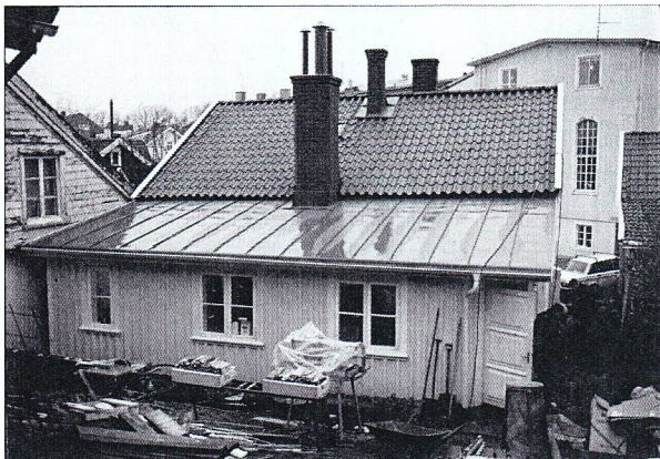
Snedtäckan efter restaureringen. 1999-12

Arbetena har godkänts vid antikvarisk slutbesiktning datum 2000-12-05.