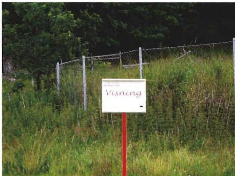
Nya skyltar visade vägen för besökare till utgrävningarna.

Under vinterhalvåret 2003 arbetade Bohusläns museum fram ett sammanhållet formprogram för den publika arkeologiska verksamheten. Till fältsäsongen 2004 hade delar av detta program realiserats och bestod av nya visningsskyltar med ny grafisk profil. En kompletterande logga för den arkeologiska verksamheten hade också tagits fram, föreställande en kruka. Denna logga skall först och främst användas i samband med annonsering av arkeologiska evenemang i Bohusläns museums månadsprogram och hemsida.