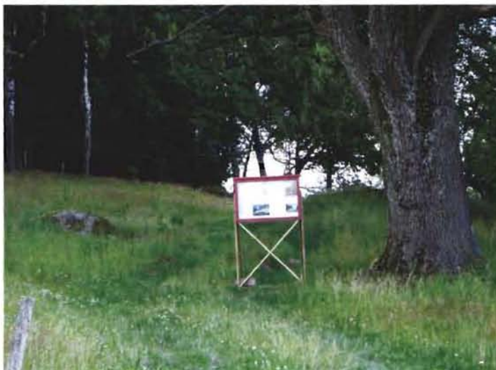
Mellan juli och oktober stod ett skyltskåp fyllt med information om pågående utgrävningar på Tungenäset.

Inom det publika projektet 2004 producerades också ett utställningsmaterial angående pågående utgrävningar på Tungenäset (se bilaga 1). Materialet bestod av text och fotografier och beskrev på ett övergripande sätt de olika utgrävningsplatserna och orsaken till exploateringen. Materialet fanns att tillgå på två platser, dels turistcentret Bohus Expo och dels i direkt anslutning till en utgrävningsplats, RAÄ 438, Foss socken, Munkedals kommun. På Bohus Expo anslags texterna och bilderna på en vikskärm vilken stod i nära anslutning till informationsdisken. Vikskärmen stod uppställd mellan juli och oktober månad. Vid RAÄ 438 användes ett så kallat skyltskåp för montering av text och bild. Skåpet stod på platsen mellan juli och december.