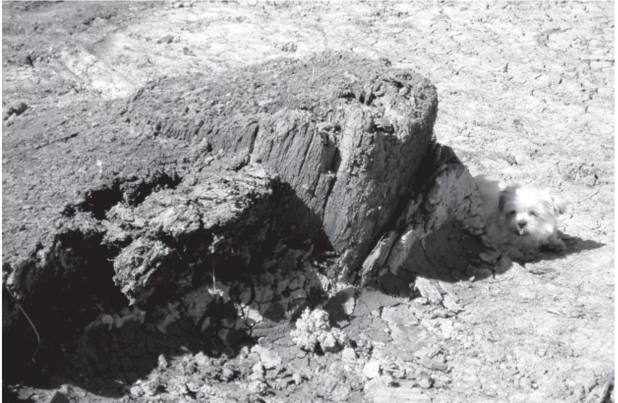
Figur 5. Bilden visar den största uppstickande stammen på platsen. Dess lutning har säkerligen tillkommit i samband med skredet. Längs rotens södra kant fanns ansamlad stora mängder organiskt material, främst små barkflakor.