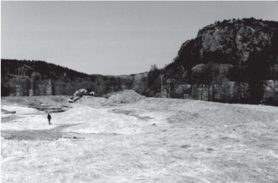
Figur 3. Översiktsbild över dammbygget. Personen går på dammens blivande botten medan grävmaskinen står på den vall som omgärdar dammen. Trädridån strax bakom dammen växer längs den nuvarande bäcken.

kontaktade antikvariska myndigheter. Platsen besöktes initialt av Lasse Bengtsson från Vitlycke museum och senare även av Roger Nyqvist på Bohusläns museum. Utifrån de högst påtagliga indikationerna om att platsen kunde utgöra en typ av hägnad och/eller en kultplats, gjordes en rimlig bedömningen att fyndförhållandena borde kontrolleras närmare. Detta inte minst med tanke på att det ligger en gravhög (RAÄ 500) bara ett par hundra meter från fyndplatsen samt eventuellt ytterligare en gravhög cirka hundrafemtio meter mot nordväst. Vid den efterföljande kontrollen, som ägde rum med mycket kort varsel, var redan det mesta av jordlagren bortgrävda. Den antikvariska kontrollen bekostades av Länsstyrelsen i Västra Götalands län.