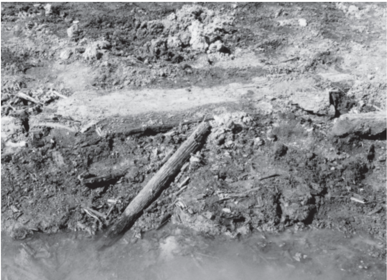
Figur 7. Bilden visar en smalare trästam eller en stör som är bränd i ena änden. Bakom denna ligger en kraftig stock djupt nedsjunken bland pinnar, bark, löv och annat organiskt material vilka har tillkommit någon gång efter skredet.

Inför byggandet av ny E6, sträckan Geddeknippeln - Håby, ställdes arkeologerna inför en situation som i hög grad påminner om den i Rönningen. På fastigheten Hålan 3:1 i Skredsvik socken påträffades i lera strax invid en bäck obearbetade trästammar som låg tillsammans med plankfragment, trästycken med kvadratisk tvärsnitt, huggspån m.m. En C14-datering av ett huggspån visade att träet var från tidig medeltid (Ortman 2003:56). Vid en senare kontroll visade det sig att de organiska materialen även här låg i sekundärt läge. De faktorer som gjort att organiska materialet kunnat bevaras kan sannolikt även här primärt tillskrivas ett skred som påverkat en äldre bäckfåra. I jämförelse med Rönningen fanns dock betydligt brantare sluttningar strax intill fyndplatsen. Jordskred kan emellertid inträffa även på förhållandevis plan mark. Ett exempel på ett sådant skred är det som ägde rum 1901 vid Saltkällans hållplats beläget strax norr om Saltkällans säteri i Foss socken. Lutningen var här bara 1:10 (von Post 1986:203).