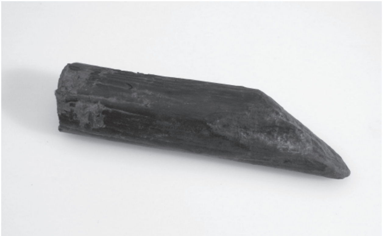
Figur 8. En 130 mm lång och 30 mm tjock träpinne där ena snittytan av allt att döma tillkommit genom yxhugg.