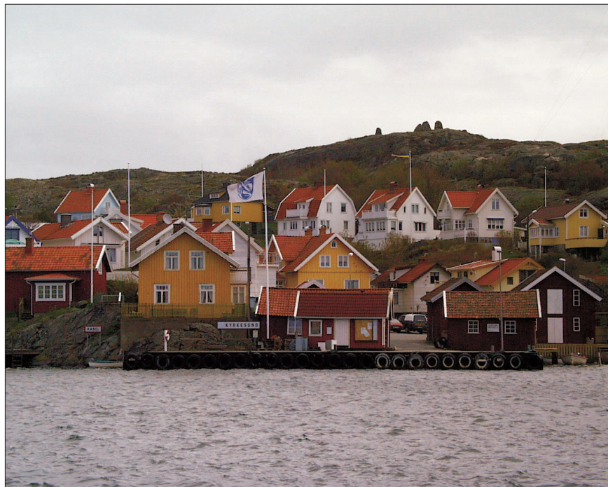
Figur 2. Östra stranden av Kyrkesund, vid "Sumpen". På krönet av berget i fonden syns de s.k. S:t Olofs valar.

västsidan av det karga Härön möter det öppna havet, och österut vidtar ett typisk bohuslänskt sprickdalslandskap med skogsbeklädda berg och uppodlade lerjordar däremellan. Kring själva sundet karakteriseras landskapet av höga bergsformationer som, åtminstone ställvis, stupar ganska brant ned i havet. Växtligheten är sparsam och består företrädesvis av gräs- och buskvegetation på de lägre och mera skyddade partierna.