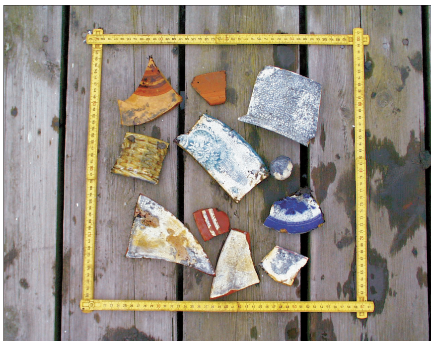
Figur 4. Exempel på keramikfynd från landföringen på Härösidan.

Det är i sammanhanget intressant att notera att flera av fornlämningarna i den folkliga traditionen har associerats med det norska helgonet S:t Olof, även kallad "Olof den helige" (se ovan). Eventuellt skulle detta förhållande kunna antyda att sundet redan under medeltiden brukades som hamn av pilgrimer på resa till och från Nidaros/Trondheim. Dylika "helgade" hamnar återfinns på flera håll i Norden, inte minst längs Norrlandskusten (jfr t.ex. S:t Olofshamnen på Drakön i Hälsingland och S:t Olofs hamn i Selånger, Medelpad – se Westerdahl 1989:184 för en aktuell översikt).