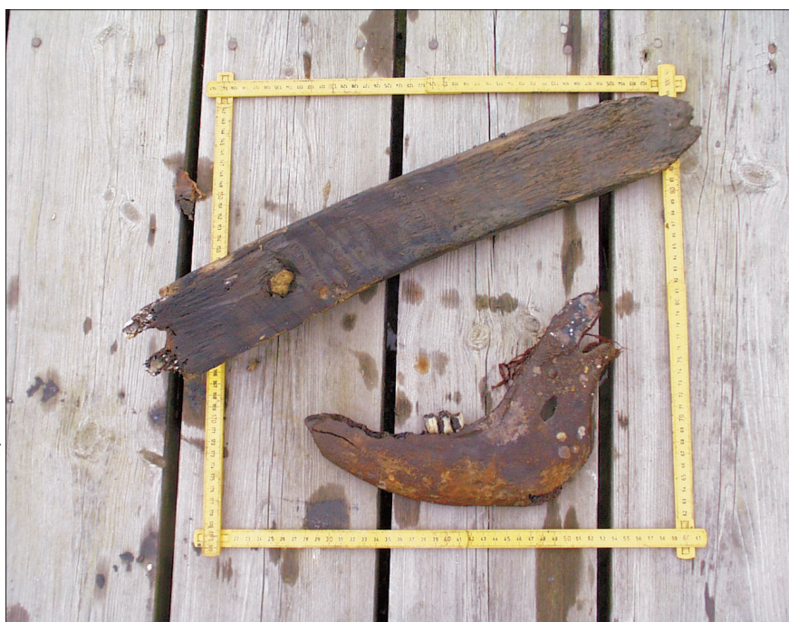
Figur 5. Spantdel och del av djurkäke, troligen av nötboskap, vilka påträffades vid landföringen på Härösidan.