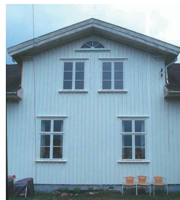
Framtaget lunettfönster på sydfasaden.

Färgsättning: Målning av sydfasad och de nya fönsterna med Wibo linoljefärg, i enlighet med Sven-Olof Hjorts måleribeskrivning, dvs: Fönster, karm, båge och foder i en ljus blågrå kulör (1B - 44). Fasad inklusive takutsprång i en ljusgul kulör (5A - 94/30).