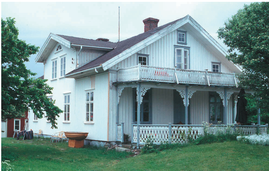
Sydfasad efter renovering.

Stomme: Byte av delar av stående "plank" på absidens södra del.