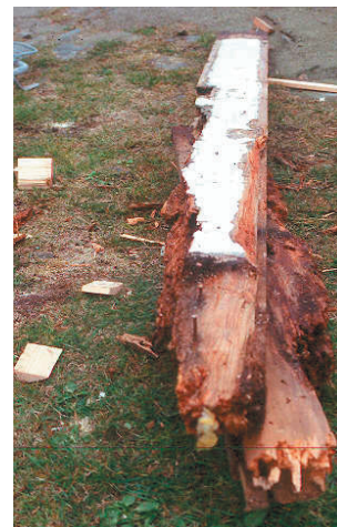
Rötskador på plankvägg.

Balkongdörren på övervåningen visade sig vara i bättre skick än förmodat och har därför enbart glasats, eventuellt åtgärdas den i ett senare skede.