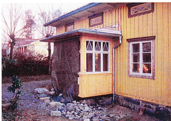
Den nya verandan under uppförande

Norrmannebo 3:24 har sitt ursprung som mindre jordbruk vilket sannolikt varit kompletterat med bisysslor. Bostadshuset är ett tämligen traditionellt dubbelhus från 1870-talet med mycket av det ursprungliga snickeriet och karaktärsdetaljerna bevarade.