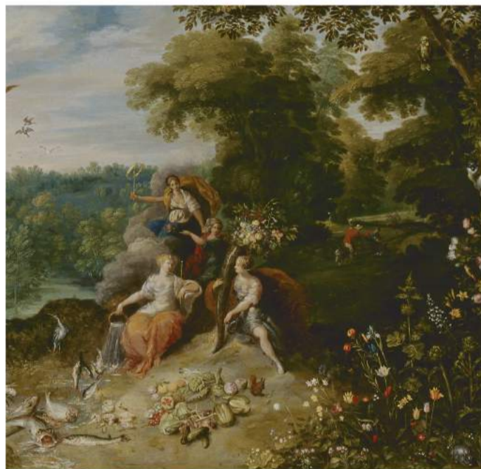
De fyra årstiderna (beskuren), Jan Breugel d.ä.